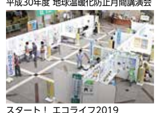
スタート! エコライフ2019