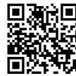
これまでの入賞作品が見られます